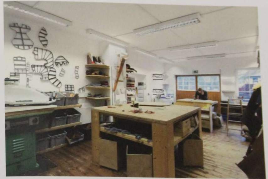
Die Hofstatterei Cosack findet sich in historischen Räumen auf dem Rittergut Wildhausen bei Arnberg und fertigt Maßbättel an. Der hölzerne Sattelbaum wird mit einer Maschine gefräst. Die weitere Arbeit erfolgt weitestgehend von Hand.