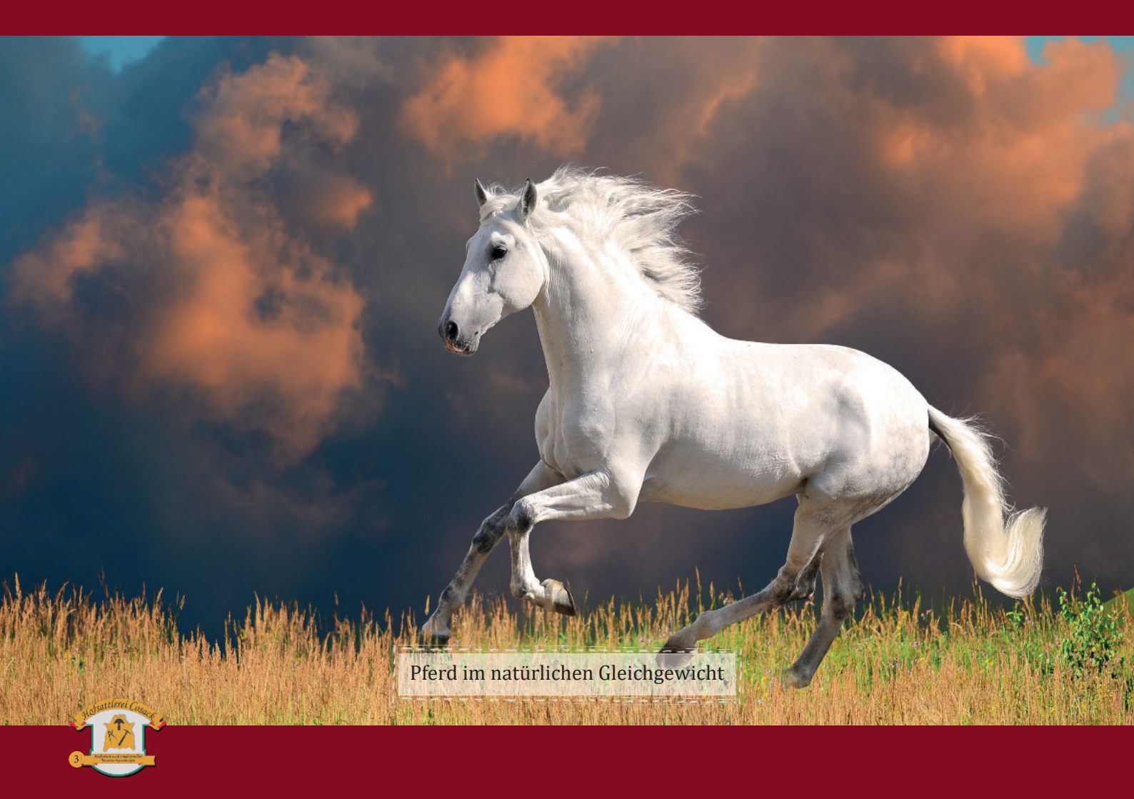
Pferd im natürlichen Gleichgewicht