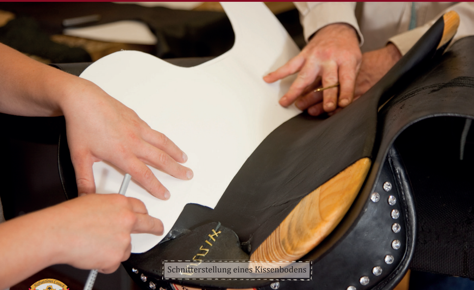
Schnitterstellung eines Kissenbodens