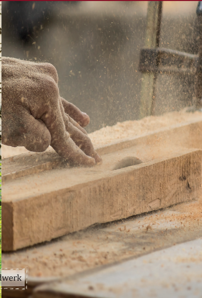
Birkenhain / Schreinerhandwerk