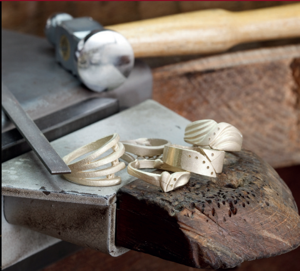
Sandgussverfahren / Goldschmiedekunst